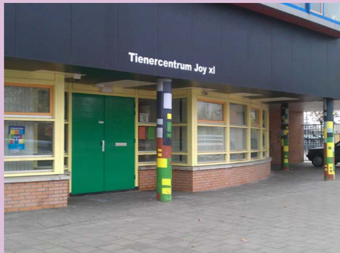
Tienercentrum Joy XL