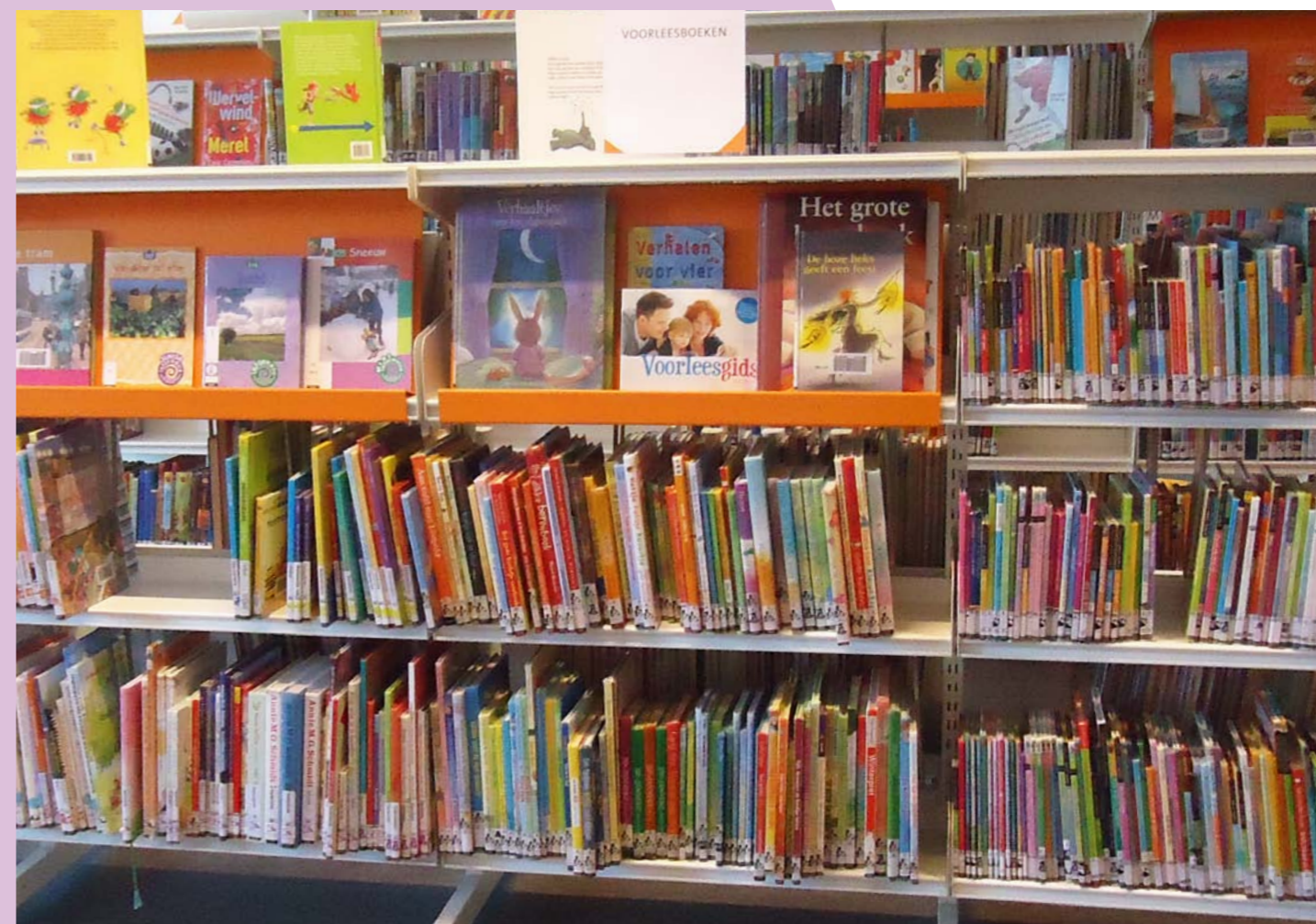
Kleurige kinderboeken in de bibliotheek

JAARGANG 1 • NUMMER 3 • SEPTEMBER 2012 • GOUDA OOSTERWEI